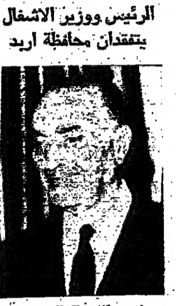
الرئيس ووزير الامتغال يتفتدان محافظة اريد

طلب عربي اجلعي تمنع طرد لاجئي غزة الامم المتحدة - رويتر - طلبت الدول العربية من يوانات السكرتير العام للأمم المتحدة ارسال ممثل خاص عنه الى الشرق الاوسط للتحقق في مزعم اسرائيل ابعاد خمسين الف لاجئ فلسطيني من قطاع غزة الى الضفة الشرقية من الاردن . وقالت في رسالة بعثت بها الي يوانات ان الاطلاق في منع اسرائيل من تنفيذ هذه الخطوة التقنية مستحسباً على اخلاف طرود اخرى مماثلة مما يؤدي الى زيادة خطورة الوضع القابل البقية على الصفحة السادسة عمود ٢